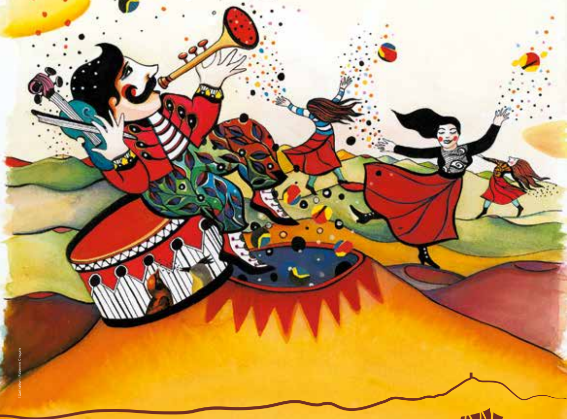
Illustration Fabienne Croquin